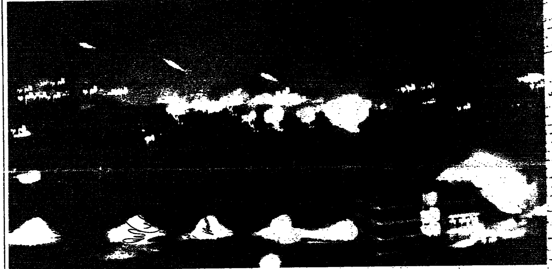
مشهد عام للمنطقة الممتدة من على الزعرور بالخرابة ومن القيل وجسر الباشا والجمعة وعين الرماله وللشياخ وخطها الاشترية والكرنيسا اتاه تصاعد عمليات تبادل القصف بانفجارية والصواريخ ايلة امس الاول

من « حرب الشواطي » الى « حرب الشواطي » ، ومن « الحرب المتحركة » الى « الحرب المتحركة » ، وتحدث تبادل كذا شجعت جبهات القتال لتصل الى الشياخ الى حين الرملة ، ومن مار مغايل في الاشترية التي تحطت الكرتينا ، وقالا امه من عين الرملة حتى شفق « فينيصا » ، وجابهة تسي الصافي - القناري ، واشتد تبادل الصنف في سن الليل والتعب والعدوانة في القتال وجس الباشا ، والتمتع واللكي ، والناصره ورأس التبع ، وسقطت القاذف بالممرات فوق الاعياء المتكبة وقد اجالواطون الى الاجراء ، وقد عسدت الاصابات في المعركة التي بلغت اثناسه مستوى امس ، بهوالي ٥٠ قتلا ونحو ١٢٠ جرحا . وكانت المارك المتحركة عنيفة امس في محلة ميناء الحصن ، وحدث تبادل والصواريخ والقاذف الصاروخية ودماع الهاون في شوارع عين الرملة وحاول وعبر الداموق وغر الدين ، وحاول